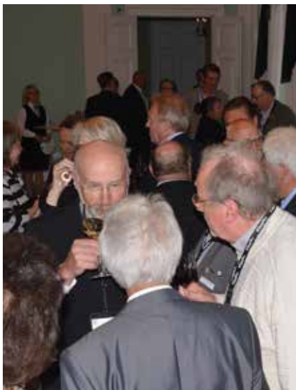
Juhlavieraita Helsingin kaupungintalon Empire-salissa.