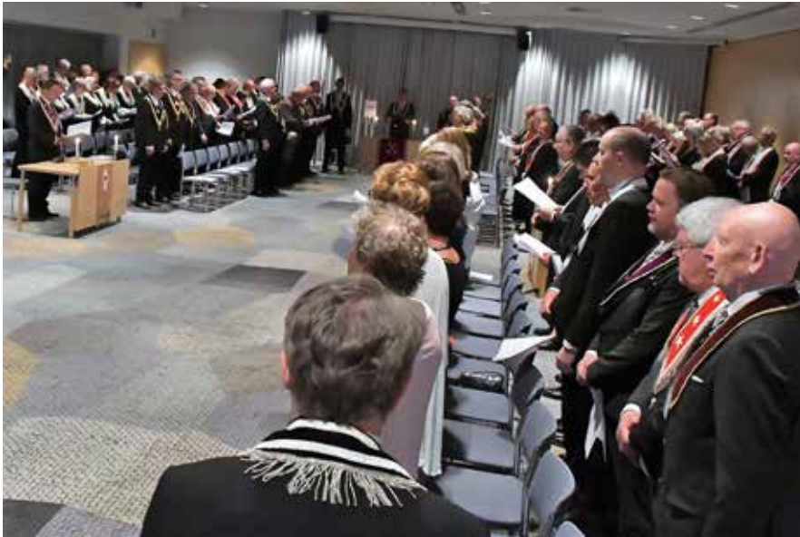
Arvokas Juhlaloosikokous pidettiin Marina Congress Centerin Fennia-salissa.